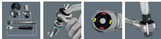
schmale Kopfform langer Hebel