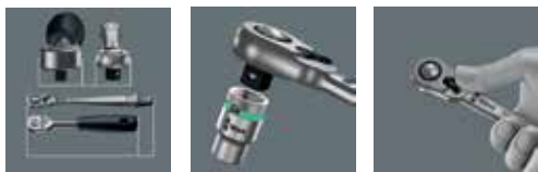
schmale Kopfform langer Hebel