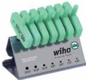
7P TORX PLUS®