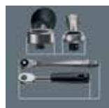
schmale Kopfform langer Hebel