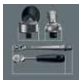
schmale Kopfform langer Hebel